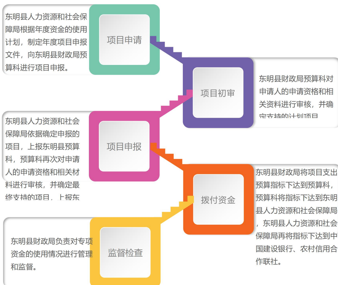
图1：东明县机关事业单位基本养老保险项目资金拨付流程图